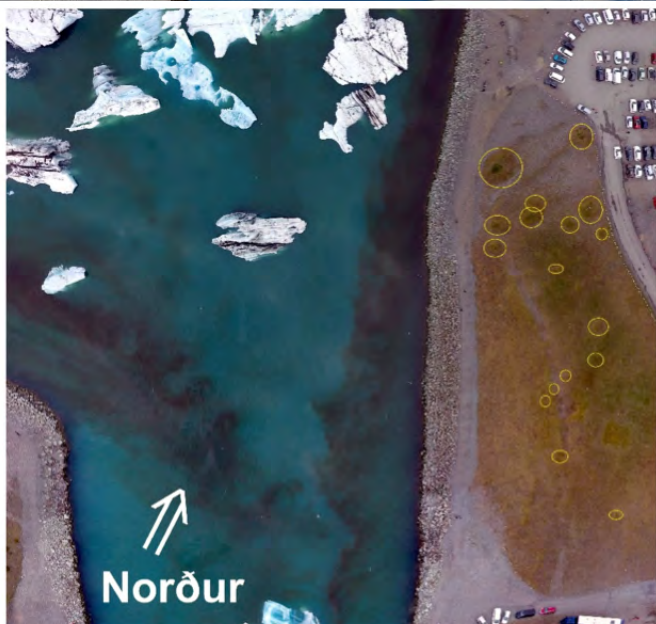
6. mynd. Jökulkerin (merkt gulum hringjum) á bakka Jökulsár má telja hafa myndast í hlaupinu 1927. Minnstu munaði að þau færu undir bílastæði fyrir nokkrum árum en því var afstýrt á elleftu stundu. – Shallow kettle holes on the east bank of Jökulsá, a remnants of the jökulhlaup 1927. 1. mars 2017.

ir það fór hlaup í Jökulsá ekki aftur yfir þetta svæði. Annað hlaup á sama stað hefði vafalítið kaffært jökulkerin í setframburði eða rofið þau burtu. Næsta hlaup sem vitað er um að hafi komið í Jökulsá var 1941, þá hafði lón myndast og áin komin í fastan farveg (Flosi Björnsson 1993).