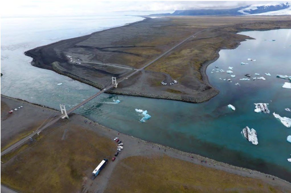
1. mynd. Jökulsá á Breiðamerkursandi og brúin yfir hana. – The glacial river Jökulsá á Breiðamerkursandi and the bridge. 13. júní 2018.

og þegar botninn hækkar nægilega leita árnar í nýja farvegi. Aurburðarmætti Jökulsár er töluvert en svo undarlega sem það hljómar var það aðeins mælt einu sinni áður en áin fór að renna frá lóninu. Norski jarðfræðingurinn Amund Helland (1846–1918) mældi aurburð nokkurra áa á Íslandi, síðsumars árið 1881. Þeirra á meðal voru Skeiðará (rennsli 150 \text{ m}^3/\text{s} og 570 \text{ g/m}^3 aurs) og Jökulsá á Breiðamerkursandi, en rennsli hennar var 120 \text{ m}^3/\text{s} og bar hún 1876 \text{ g/m}^3 af aur með sér (Sigurjón Rist, 1974).