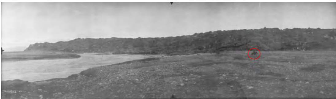
4. mynd. Jökulsá á Breiðamerkursandi og frambrún Breiðamerkurjökuls árið 1902. Þessi farvegur er enn sjáanlegur á Sandinum. Takið eftir manni og hesti til hægri. – Jökulsá á Breiðamerkursandi and the terminus of Breiðamerkurjökull outlet glacier, in 1902. This river bed is still visible at the 'Sandur' plain. Notice the rider to the right of the river.