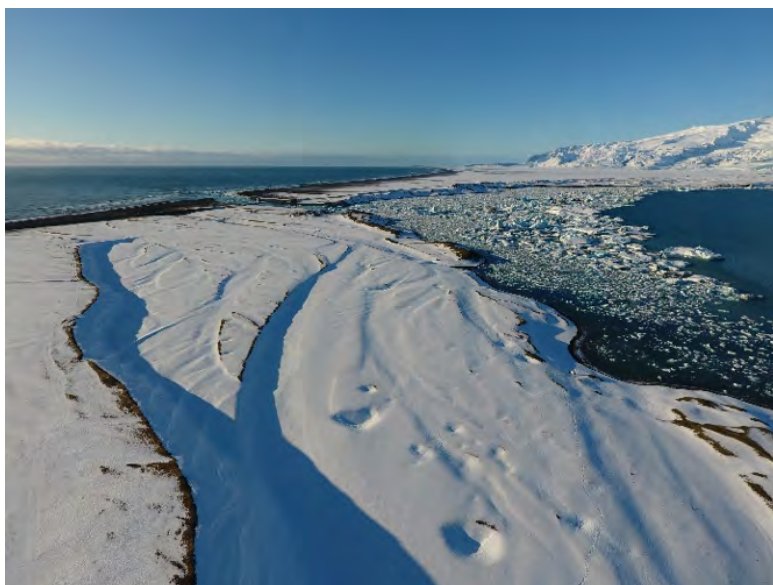
5. mynd. Jökulkerin í farvegum Jökulsár sem telja má hafa myndast í kjölfar hlaupsins 1927. – Kettle holes in former riverbeds of Jökulsá, assumed to be the remnants from the great jökulhlaup on September 7th, 1927. Ljósmynd./Photo: Náttúrustofa Suðausturlands/Snævarr Guðmundsson, 1. mars 2017.